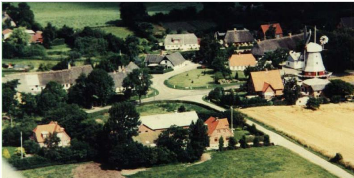
"Indgang" til Elstrup. Billedet er taget i 1977