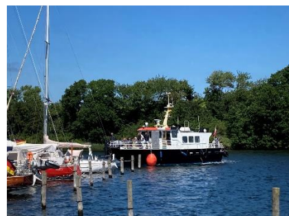
Billede: Cykelfærgen sejlede en specialsejladse ifbm. besøg af Folketingets udvalg for Landdistrikter og Øer den 21. juni 2022