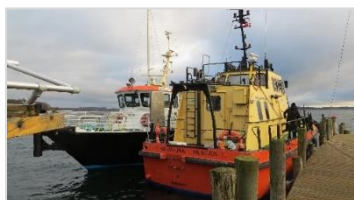
MS "Rødsand" and "Skawlink"