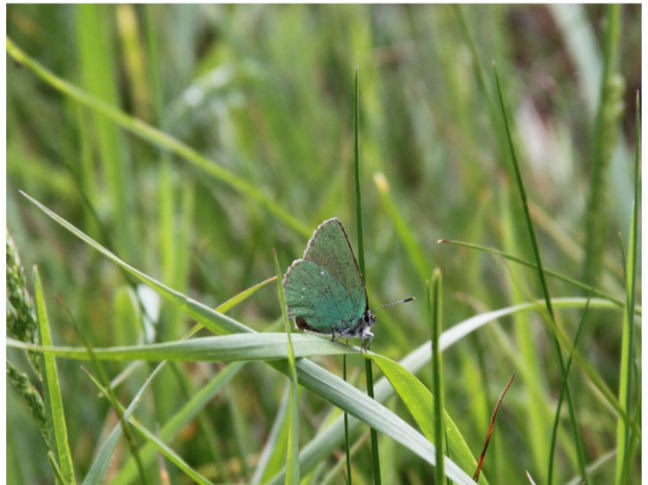
Eksempler på faunainteraktioner. Øverst tv. almindelig knopurt ( Centaurea jacea ) med citronsommerfugl ( Gonepteryx rhamni ), øverst th. pil ( Salix sp.) med dagpåfugleøje ( Aglais io ), midten tv. slåen ( Prunus spinosa ) med dagpåfugleøje, midten th. agertid-sel ( Cirsium arvense ) med det hvide w ( Satyrium w-album ), nederst tv. alm. røllike ( Achillea millefolium ) med dukatsommerfugl ( Lycaena virgaureae ) og nederst th. grøn busksommerfugl ( Callophrys rubi ) på græs.