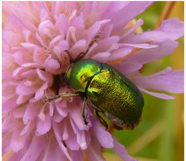
Blåhat ( Knautia arvensis ) indgår i mange faunainteraktioner. Her seks eksempler. Øverst tv. blåhatblomstertæge ( Placochilus seladonicus ), øverst th. blåhatjordbi ( Andrena hattorfiana ), midten tv. blåhat-langhornsmøl ( Nemophora metallica ), midten th. agerhumle ( Bombus pascuorum ) og blåhatjordbi (flyvende), nederst tv. klitperlemorsommerfugl ( Fabriciana niobe ) og nederst th. en faldbille (sandsynligvis Cryptocephalus aureolus ).